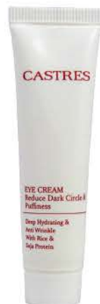
کرم ضد چروک قوی دور چشم Eye Cream Reduce Dark Circle & Puffiness