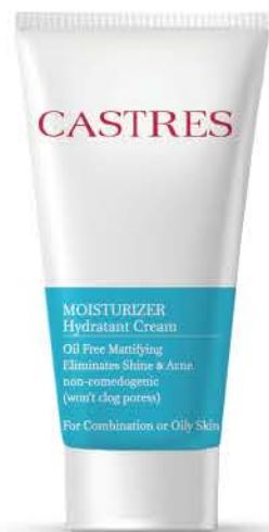
کرم آبرسان پوست چرب و مختلط Moisturizer Hydratant Cream