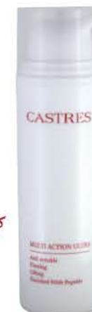
کرم استحکام بخش و ضد چروک قوی صورت MultiAction Ultra